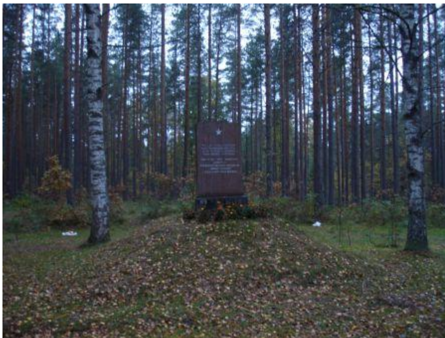
Общий вид братского кладбища.