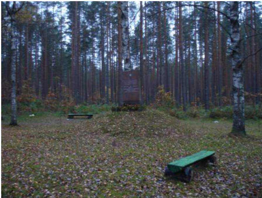
Общий вид братского кладбища.

Кладбище расположено в лесу севернее шоссе E22/A12. От дороги к кладбищу ведёт просёлочная дорога длиной 250 метров. Состояние кладбища хорошее. На кладбище на кургане установлен памятник. Состояние памятника хорошее. Надписи читаются хорошо.