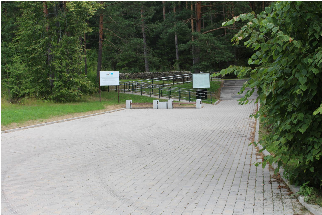
Южный вход на братское кладбище