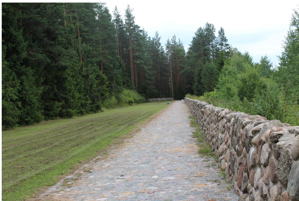
Общий вид братских могил