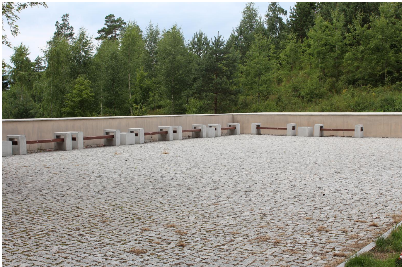
Каменная площадка на террасе мемориала