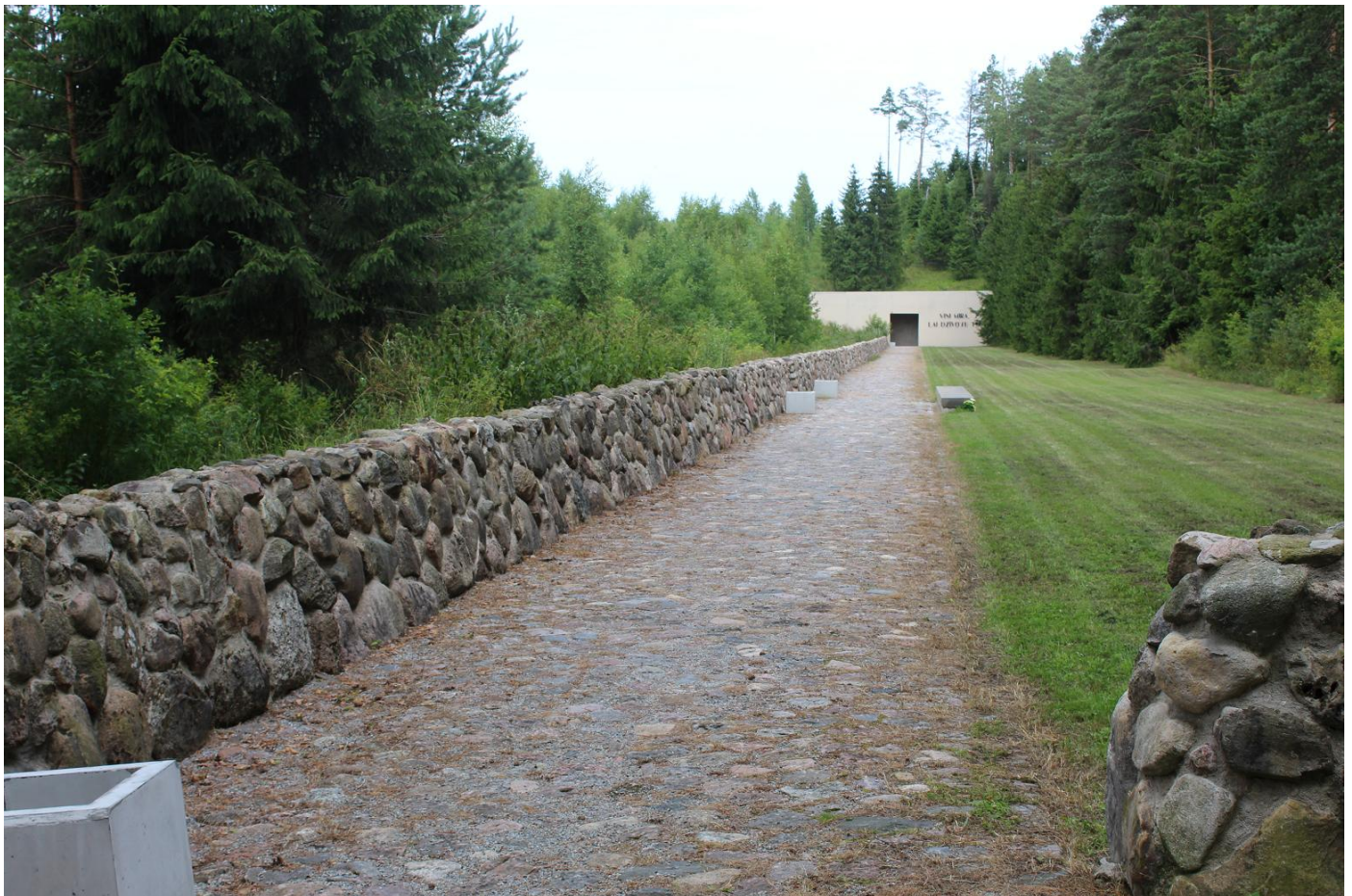
Каменная дорожка и ограждения на мемориале