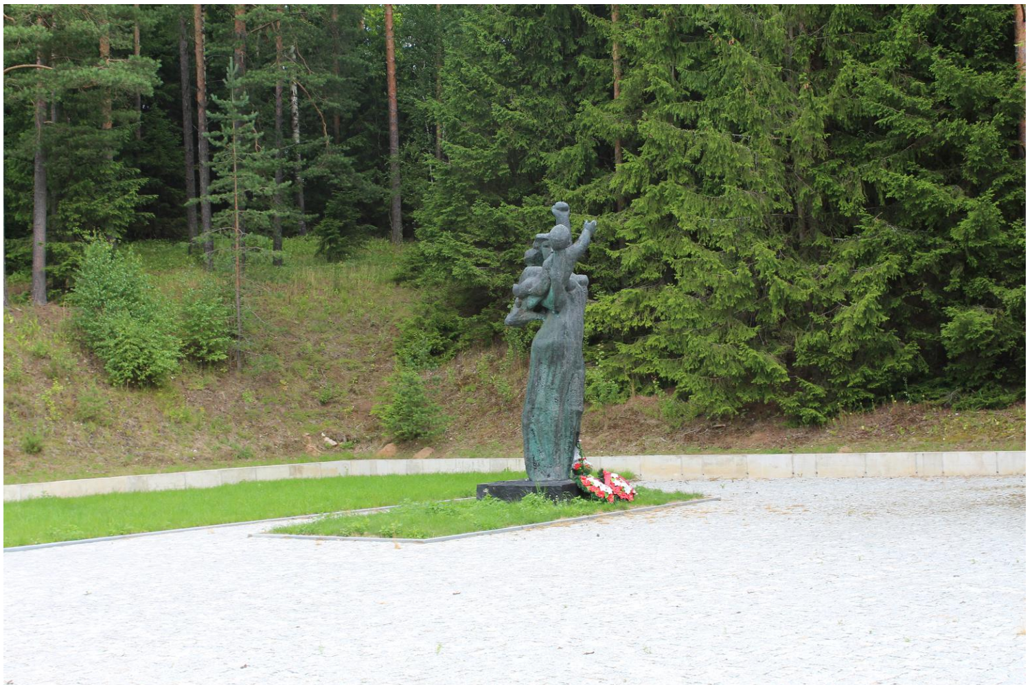
Площадка и памятник на террасе