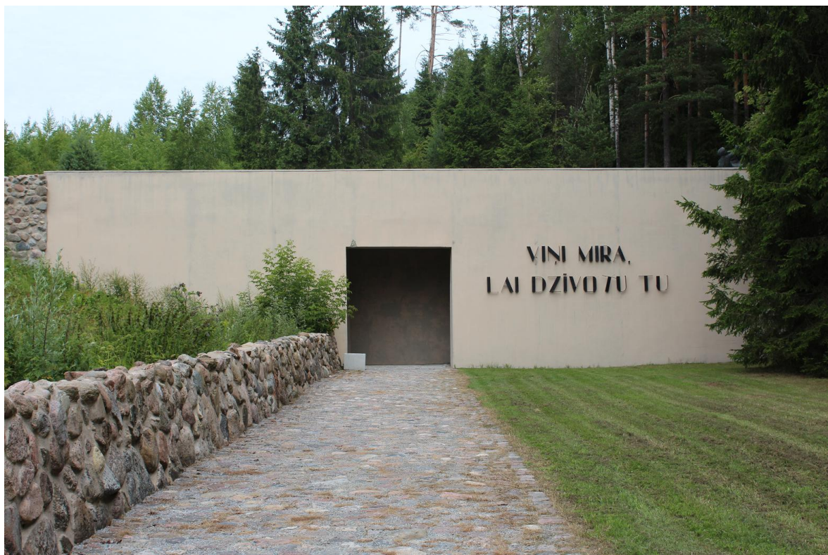
Общий вид террасы мемориала