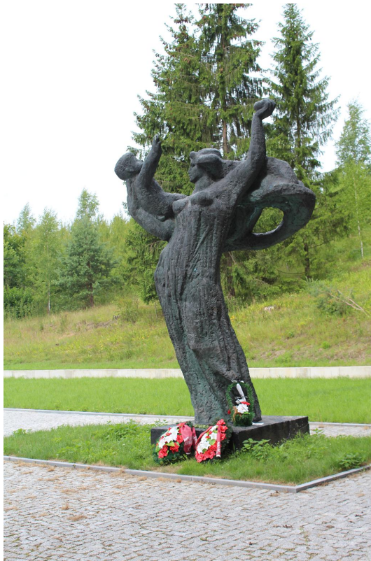
Памятник на братском кладбище.