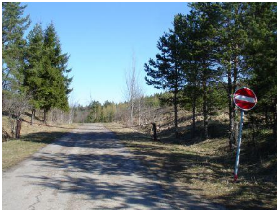
Дорога к братскому кладбищу.

К кладбищу из города Резекне (Rēzekne) ведёт асфальтовая дорога, от того места, где улица Ригас (Rīgas) переходит в шоссе Р 36 на северо-западной границе города. Дорога завершается площадкой. У южного входа на кладбище площадка выполнена из брусчатки с пандусом для инвалидов. На площадке установлен информационный указатель о захоронении с текстом на трех языках - русском, латышском, английском. На северной стороне кладбища сооружена терраса, от которой к братским могилам ведет лестница, выложенная из камня. Вдоль западной и южной сторон кладбища сооружена каменная ограда. Состояние кладбища отличное. На террасе, выложенной из камня, установлен памятник и скамейки. На стене террасы металлическими буквами выложена надпись. Состояние памятника хорошее. Надписи читаются хорошо.