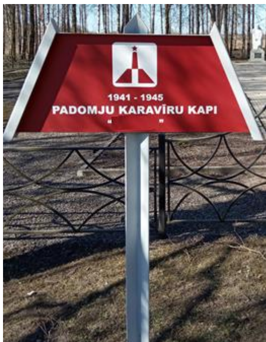
18. Указатель с названием воинского захоронения